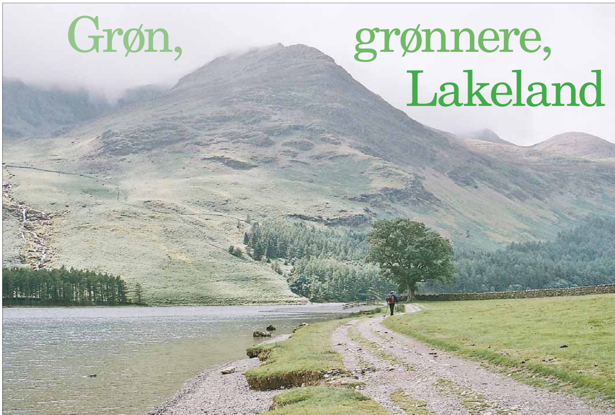
Der er et bjerg for alle, siger de i Lake District. Her ved Buttermere.

De højeste bjerge, de dybeste søer, de fleste får. Lakeland i det nordlige England byder på en smuk og dugfrisk ferietur.