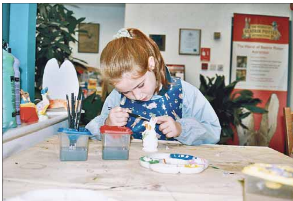
Områdets kendteste person er Potter - ikke Harry, men Beatrix, som tegnede og skrev om Peter Kanin for 100 år siden. Her er en lille pige i gang med at male Beatrix kunsten efter på Potters museum.

Endelig har Beatrix Potter også fået sit eget kunstgalleri ved Hawkshead. Indtæg-