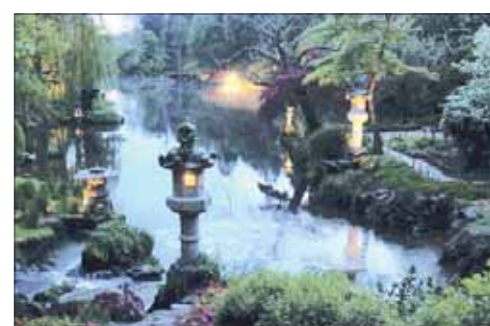
Når mørket sænker sig, tændes lysene overalt i den japanske have.

Parc Oriental de Maulévrier (12 km sydøst for Cholet) har åbent fra midten af maj til udgangen af november.