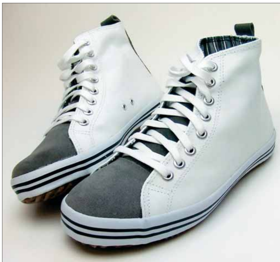
Bobbie Burns er kendt for seje rå sneakers for mænd.