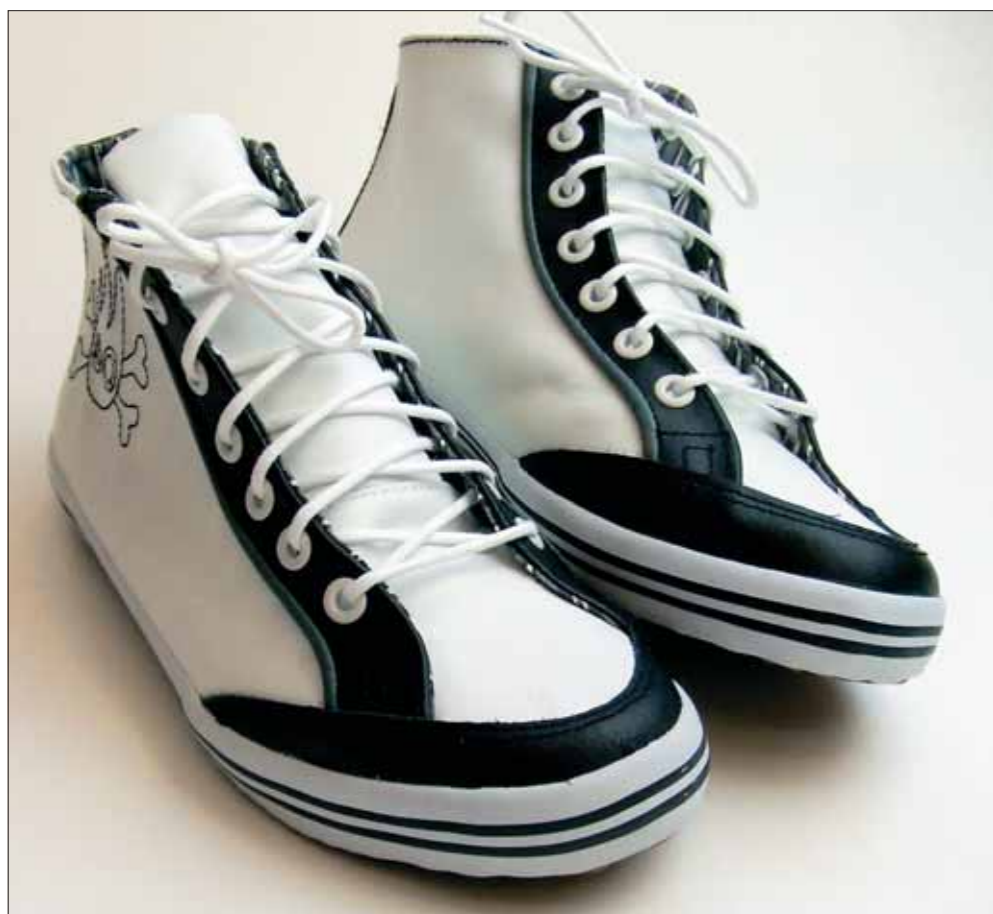
Tidens trend for seje sneakers er sort og hvidt i kontrast. Her fra Bobbie Burns.