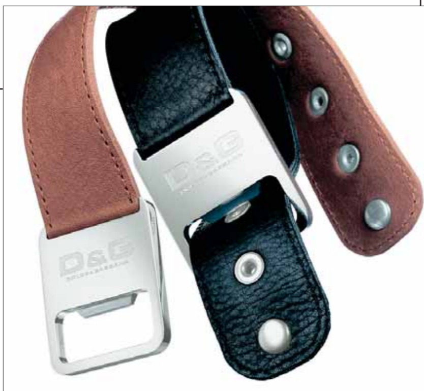
Det brede læderarmbånd til mænd indeholder en moderne og rå øloplukker langt fra fortidens samfundshjælpere.